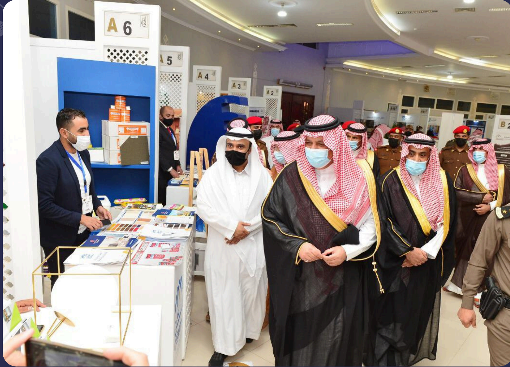
حضور سمو أمير منطقة حائل الأمير عبدالعزيز بن سعد بن عبدالعزيز