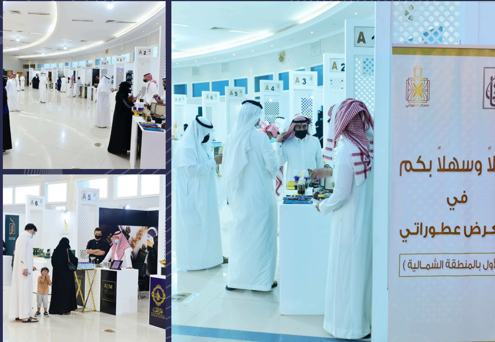
جانب من تفاعل الشركات مع زوار المعرض

فعالية عطرية مميزة أقيمت في مدينة حائل، جمعت بين أصالة العطور الشرقية وجمال العطور الغربية، بمشاركة نخبة من العطارين والعلامات التجارية. ولتقديم تجربة فريدة للزوار من خلال عرض أجود أنواع العطور، دهن العود، الزيوت العطرية، والبخور، وسط أجواء راقية تناسب جميع أفراد المجتمع .