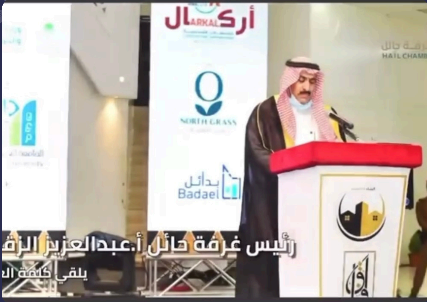
حضور رئيس غرة حائل أ. عبدالعزيز الزقدي

دشن سمو أمير منطقة حائل الأمير عبدالعزيز بن سعد بن عبدالعزيز معرض البناء والتعمير الأول المقام في صالة المعارض والمؤتمرات بمشاركة عدداً من المصانع والشركات المتخصصة في قطاع (البناء والتعمير).